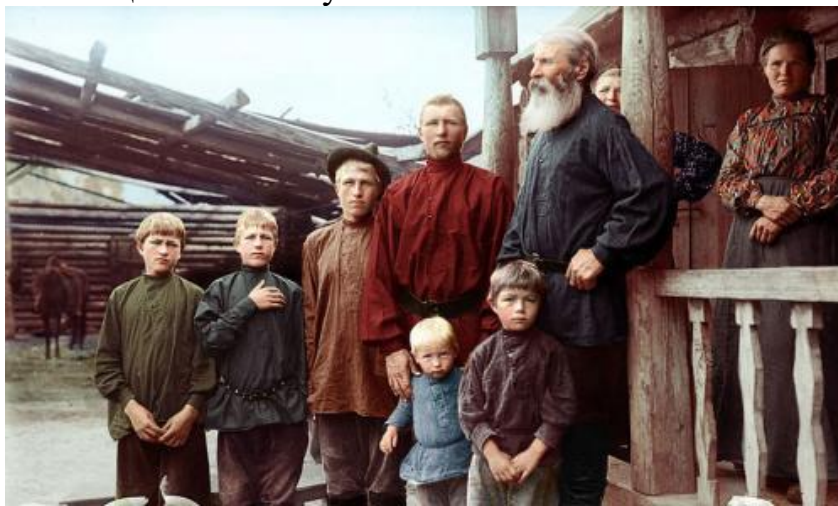
(Раскрашенный снимок русской семьи начала XX века)

Большое количество обрядов и традиций связано с семейной жизнью (это и сватовство, и свадебные торжества, и крещение детей). Проведение старинных обрядов и ритуалов гарантировало в будущем успешную и счастливую жизнь, здоровье потомков и общее благополучие семьи.