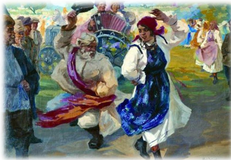
(Картина Ю.А. Зайцева "Акатуй" 1934–35 гг.)

Праздник Манкун - это чувашская Пасха. Этот праздник является самым чистым и светлым праздником для народа. Перед Манкуном женщины убирают в своих избах, а мужчины прибирают во дворе и за двором. К празднику готовятся, наполняют полные бочки пива, пекут пироги, красят яйца и готовят национальные блюда. Манкун длится семь дней, которые сопровождаются весельем, играми, песнями и танцами. Перед чувашской Пасхой на каждой улице ставились качели, на которых катались не только дети, но и взрослые.