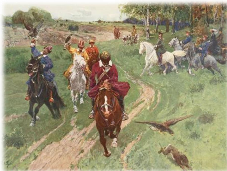
(Картина Ф.Рубо "Охота башкир с соколами в присутствии императора Александра II" 1880-е г)

Семейный быт и празднование народных праздников Башкиров практически до конца 19 столетия был подвержен строгим патриархальным устоям, в которых еще в дополнении присутствовали обычаи мусульманского шариата. В системе родства прослеживалась влияние арабских традиций, которые подразумевали четко деление линии родства на материнскую и отцовскую часть, это было необходимо впоследствии для определения статуса каждого члена семьи в наследственных вопросах. Действовало право минората (преимущество прав младшего сына), когда дом и все имущество в нем после смерти отца переходило к младшему сыну, старшие братья должны были получить свою долю наследства еще при жизни отца, когда они женились, а дочери когда выходили замуж. Раньше башкиры довольно рано выдавали своих дочерей замуж, оптимальным возрастом для этого считалось 13-14 лет (невеста), 15-16 лет (жених).